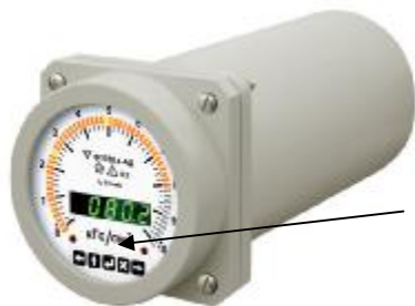
Рисунок 1 – Вид амперметров и вольтметров оптоэлектронных Ф1760 и Ф1760-АД.

Оттиск поверительного клейма, при положительных результатах поверки, наносят на стекло лицевой крышки прибора Ф1760.4-АД, у приборов других модификаций – на табличку, расположенную на верхней крышке.