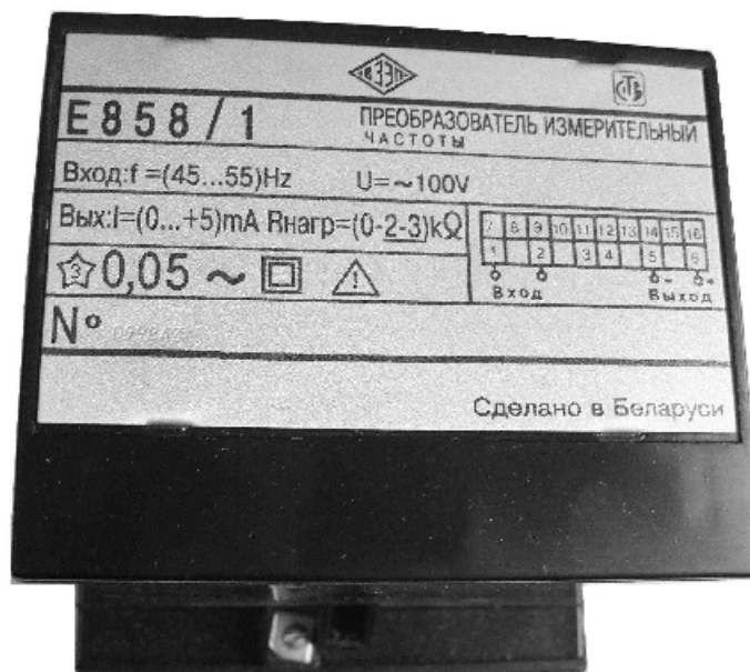
Рисунок 1 – Фотография общего вида преобразователей Е858

Конструктивное исполнение, диапазоны измерений преобразуемых входных сигналов, их номинальные значения, диапазоны изменения выходных сигналов преобразователей приведены в таблице 1.