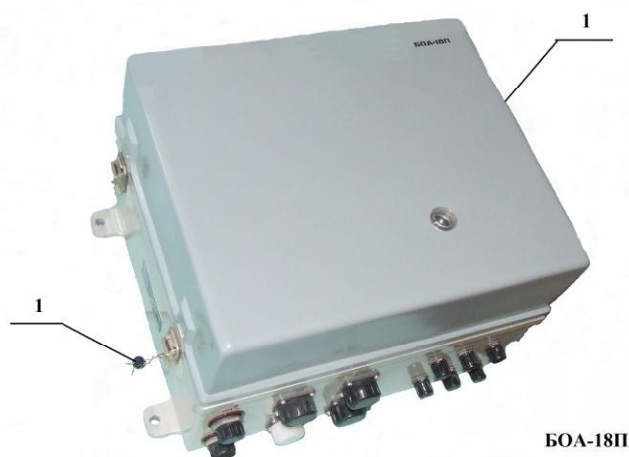
1 – Пломбы с оттиском клейма поверителя Рисунок 1 – Общий вид блока БОА-18П

Общий вид блоков УДА и расположение мест для нанесения оттисков клейм поверителя показаны на рисунках 1 и 2.