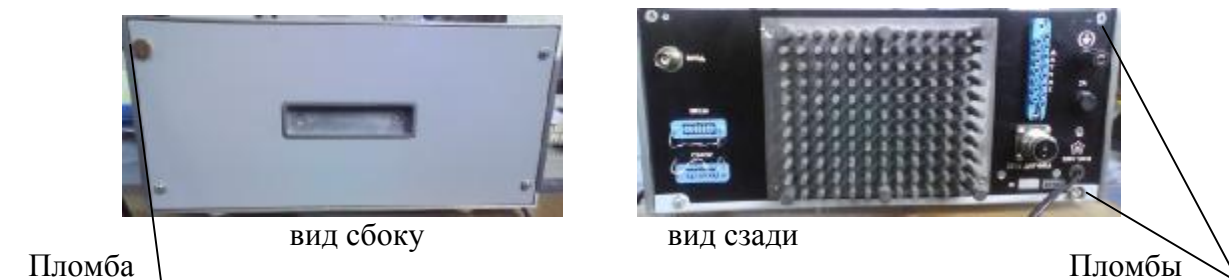
Рисунок А.2 – Схема опломбирования анализатора от несанкционированного доступа