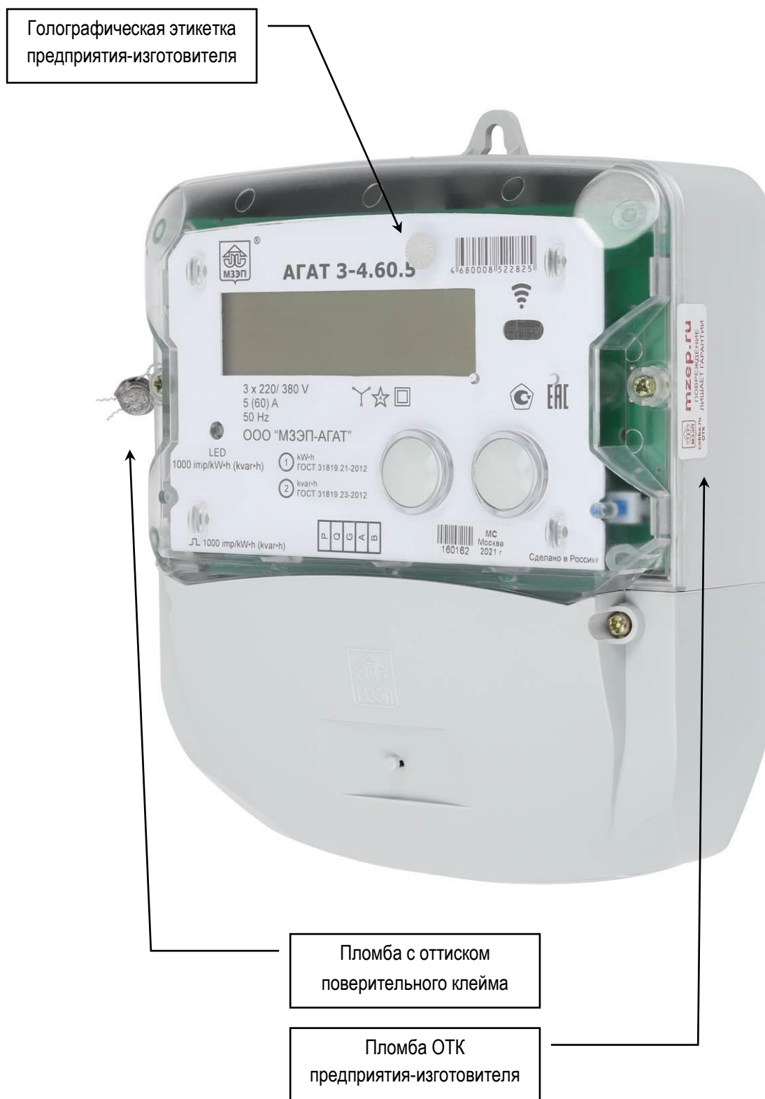
Рисунок 6 - Исполнение корпуса 4. Общий вид счетчика АГАТ 3-4.60.5