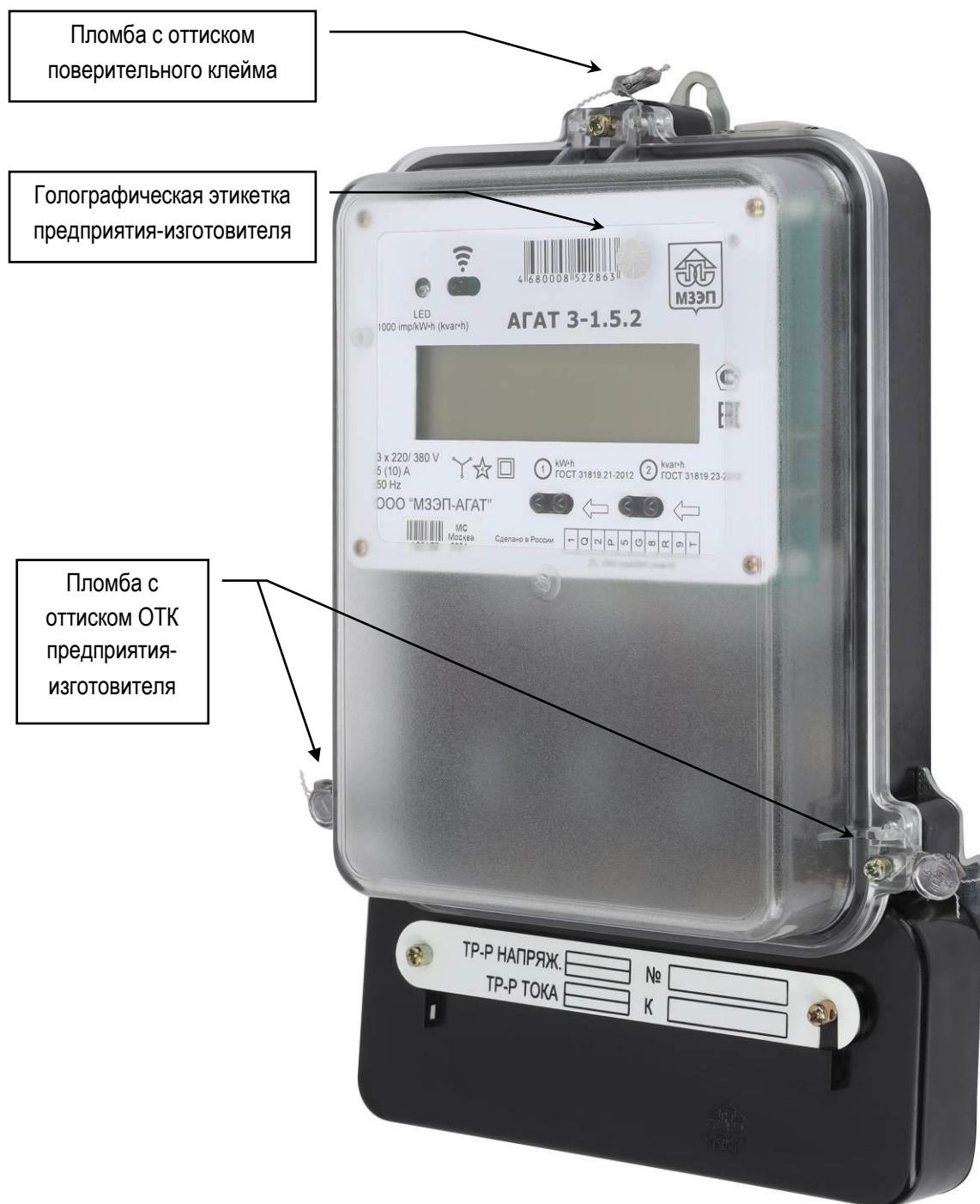
Рисунок 2 - Исполнение корпуса 1. Общий вид счетчика АГАТ 3-1.5.2