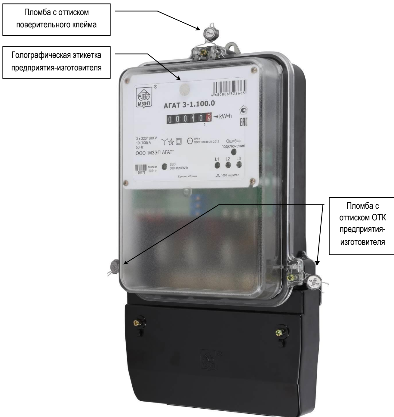
Рисунок 1 - Исполнение корпуса 1. Общий вид счетчика АГАТ 3-1.100.0

Общий вид счетчиков с указанием мест пломбирования представлен на рисунках 1÷6.