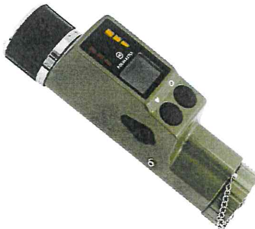
Рисунок 1 – Общий вид дозиметров

Общий вид дозиметра представлен на рисунке 1.