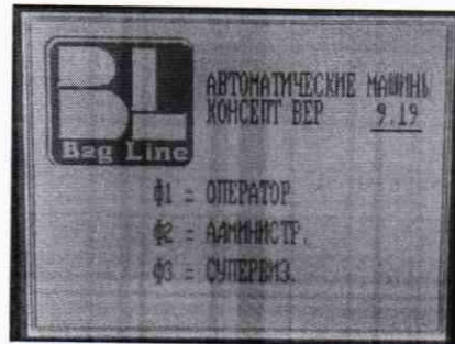
Рисунок 1 – Экран системы контроля после включения и загрузки программного обеспечения

9.1 Проверку программного обеспечения дозатора проводят путем идентификации версии: текущую версию программного обеспечения считывают с экрана системы контроля после включения и загрузки программного обеспечения (рисунок 1).