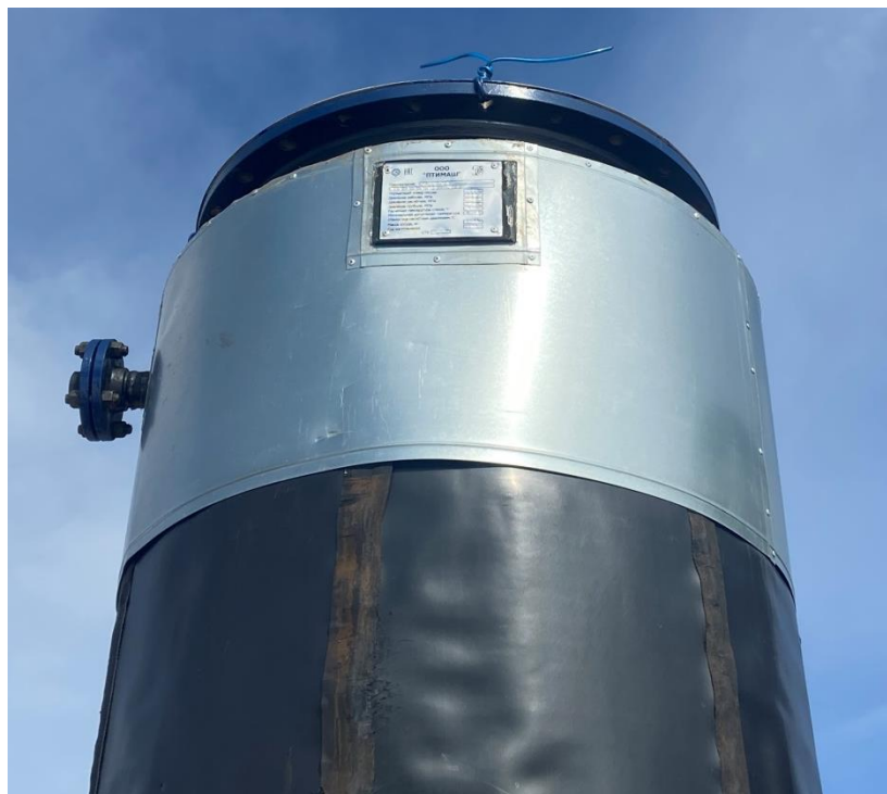
Рисунок 2 – Горловина резервуара стального горизонтального цилиндрического РГС-12,5

Пломбирование резервуара стального горизонтального цилиндрического РГС-12,5 не предусмотрено.