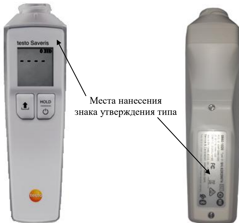
Рисунок 1 – Общий вид электронного блока Testo Saveris 0560 1020

Общий вид измерителей комбинированных Testo Saveris 0560 представлен на рисунках с 1 по 3.