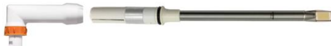
Рисунок 2 – Общий вид съемных зондов

Зонд 0440 1328 XX в комплекте с адаптером