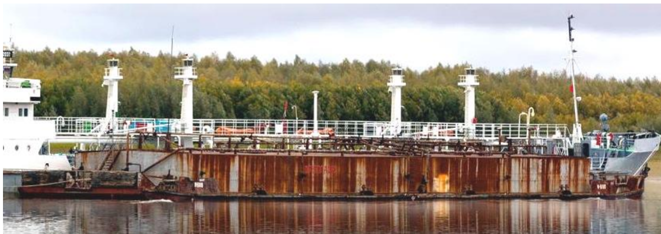
Рисунок 1 – Общий вид нефтеналивной баржи Н-900