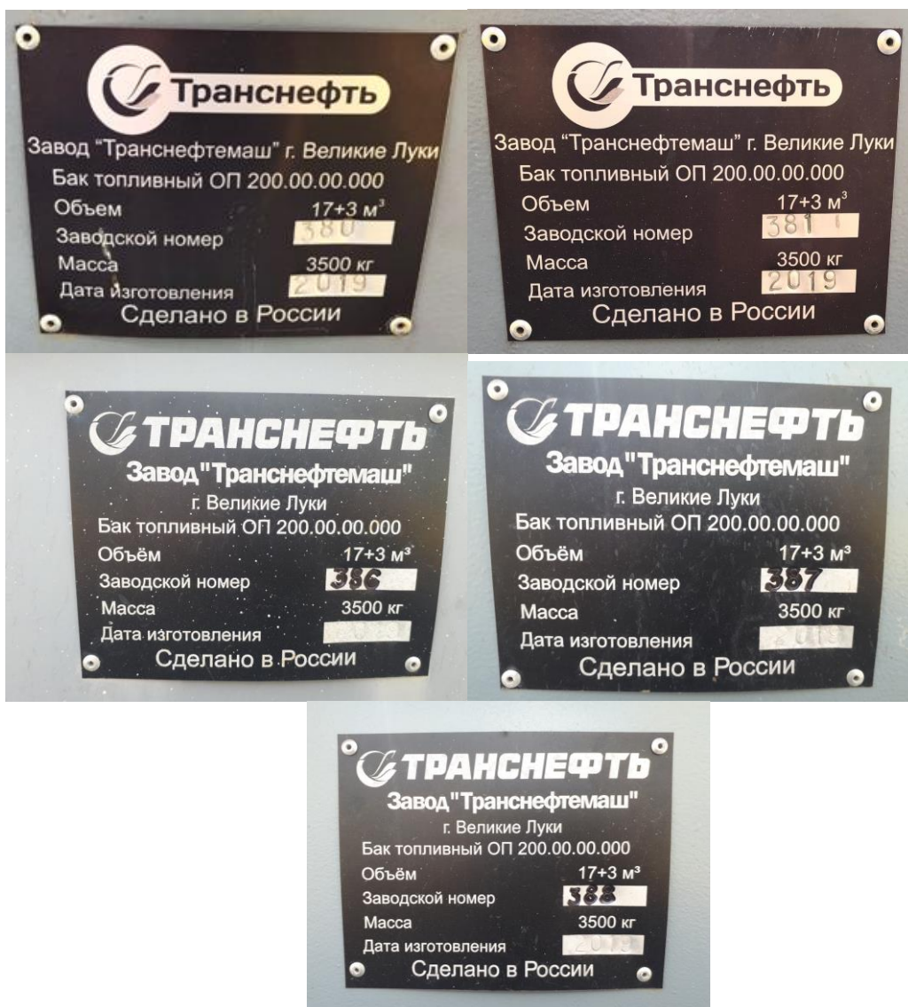
Рисунок 5 – Фотографии табличек с заводскими номерами резервуаров РГС-20 (17+3), заводские номера 380, 381, 386, 387, 388