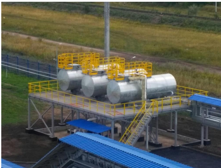
Рисунок 2 – Общий вид резервуаров РГС-20 (17+3), заводские номера 386, 387, 388