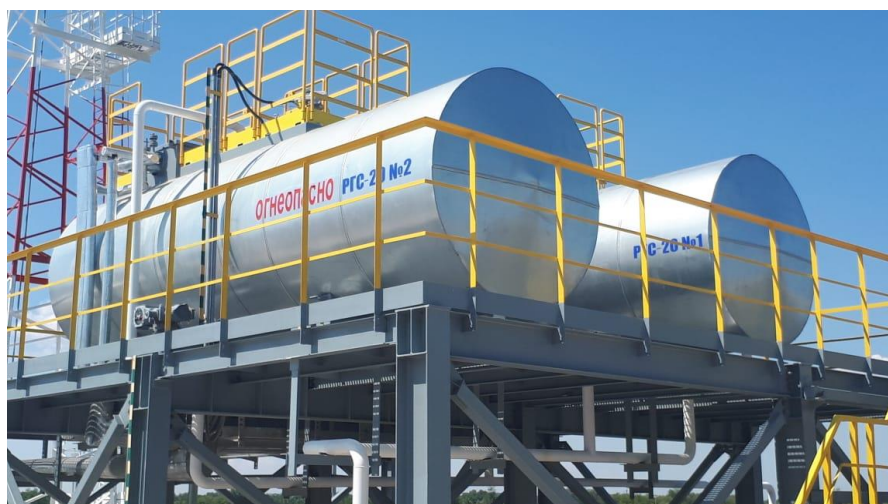
Рисунок 1 – Общий вид резервуаров РГС-20 (17+3), заводские номера 380, 381

Общий вид резервуаров стальных горизонтальных цилиндрических РГС-20 (17+3) представлен на рисунках 1 и 2. Фотографии горловин с люками первой и второй секции приведены на рисунках 3 и 4 (в качестве примера представлены для одного резервуара – конструкция всех резервуаров идентичная). Фотографии табличек с заводскими номерами резервуаров представлены на рисунке 5