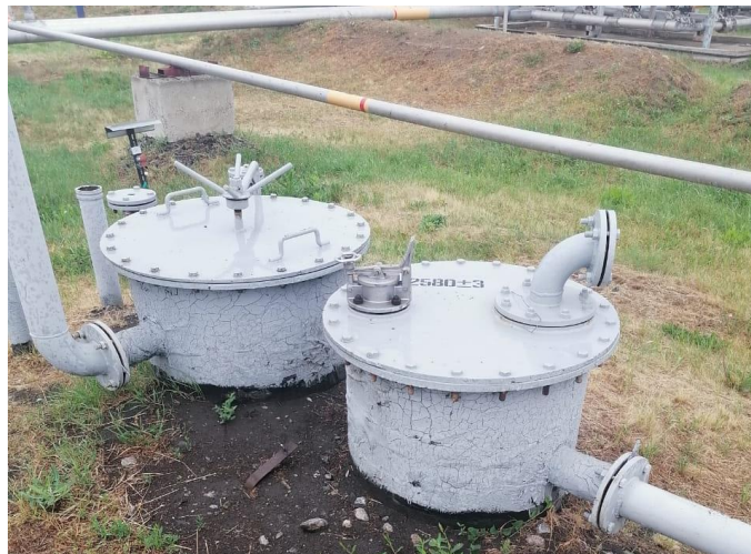
Рисунок 1 – Общий вид резервуара РГС-5

Нанесение знака поверки на средство измерений не предусмотрено.