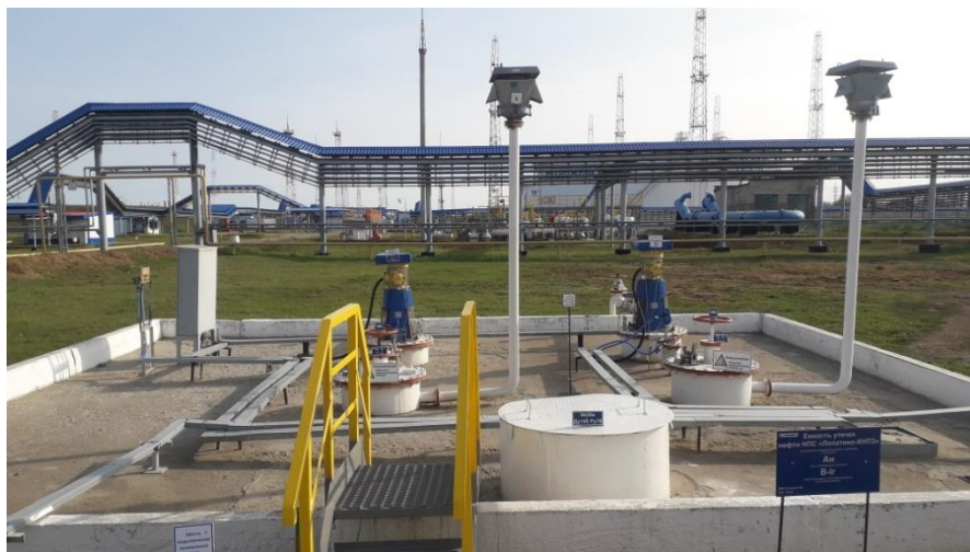
Рисунок 2 – Общий вид надземной части резервуаров РГС-25 зав.№№ ЕП-7, ЕП-8