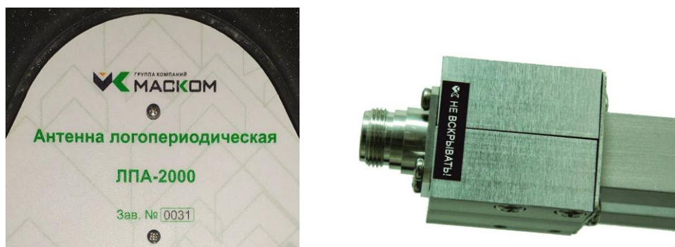
Рисунок 3 – Место пломбировки от несанкционированного доступа и нанесения заводского номера логопериодической антенны ЛПА–2000