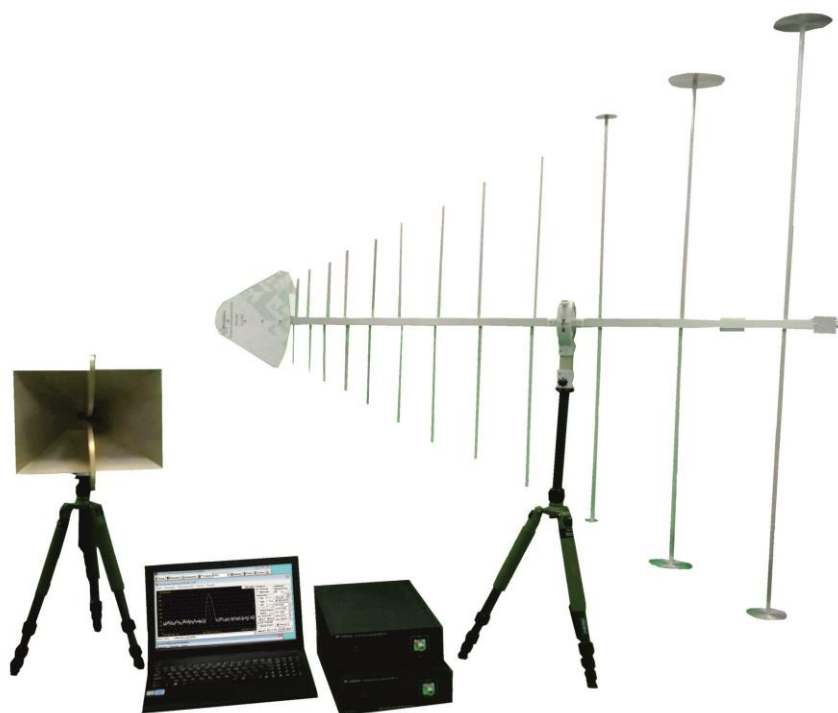
Рисунок 1 – Общий вид средства измерений