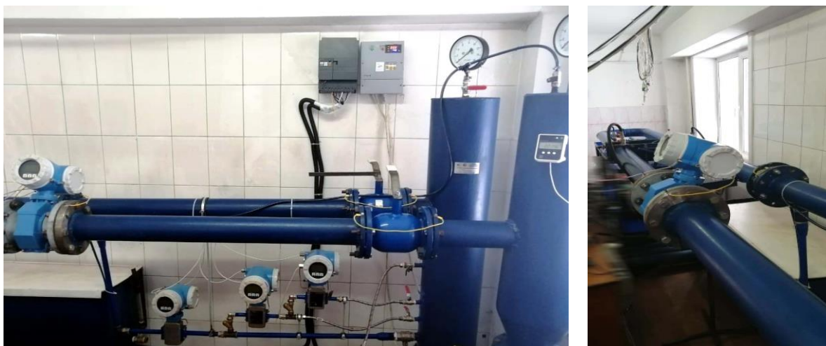
Рисунок 1 – Общий вид установок

Общий вид установок представлен на рисунке 1.