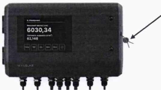
Рисунок 1 – Общий вид вычислителя расходомера ВЛТ-1 с указанием места пломбировки

11.3. Положительные результаты поверки удостоверяются отметкой в паспорте и (или) свидетельством о поверке, оформленным в соответствии с действующими нормативными документами. Знак поверки на СИ наносится в соответствии с рисунком 1.