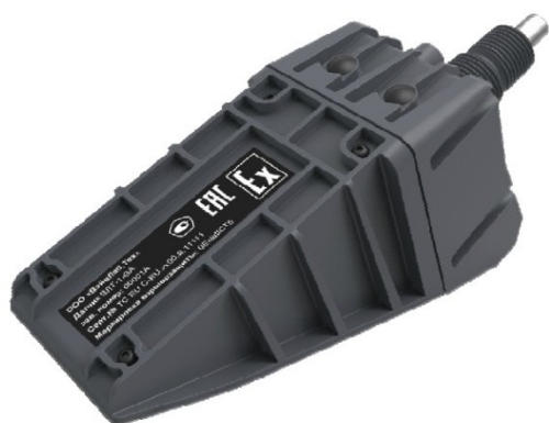
Рисунок 1 – Общий вид ПЭА ВЛТ-1

Общий вид расходомера и его составных частей с указанием мест пломбировки от несанкционированного доступа приведён на рисунках 1 – 3. Заводской номер и знак утверждения типа наносятся на маркировочную табличку ПЭА и вычислителя.