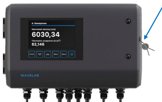
Рисунок 2 – Общий вид вычислителя расхода ВЛТ-1 с указанием места пломбировки