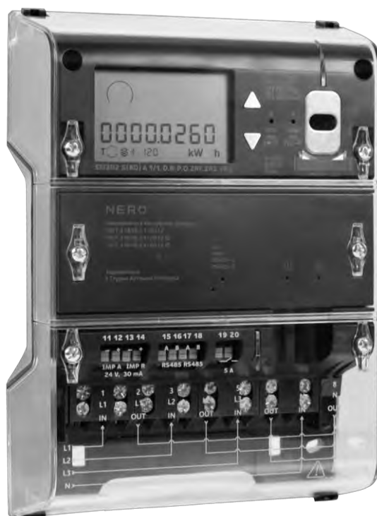
Рисунок 2 – Общий вид счётчика SM3

Фотографии общего вида счётчиков приведены на рисунке 2.