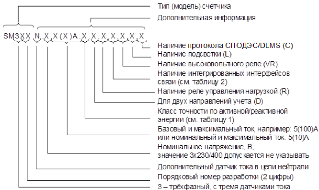
Рисунок 1 – Структура условного обозначения счётчиков

Структура условного обозначения исполнений счётчиков приведена на рисунке 1 и в таблицах 1 и 2.