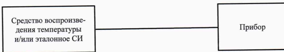
Рисунок А.2 – Схема проверки прибора при измерении температуры (для модификации ТМР)