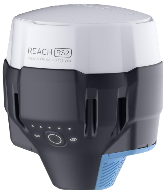
Рисунок 1 - Общий вид аппаратуры со стороны лицевой панели

В процессе эксплуатации, аппаратура не предусматривает механических и электронных внешних регулировок. Пломбирование аппаратуры не предусмотрено. Ограничение доступа к узлам обеспечено конструкцией крепёжных винтов, снятие которых возможно только при наличии специальных ключей. Общий вид аппаратуры со стороны нижней панели с указанием места нанесения знака утверждения типа представлен на рисунке 2.