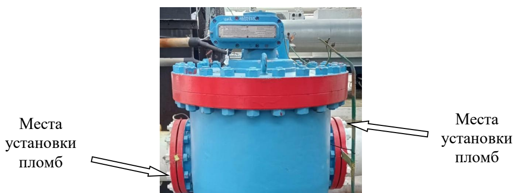
Рисунок 1 – Схема пломбировки от несанкционированного доступа ПР*

Схемы пломбировки от несанкционированного доступа с местами установки пломб представлены на рисунках 1-2.