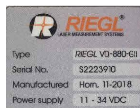
Рисунок 5 - Общий вид сканеров RIEGL VQ-880-G II