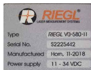
Рисунок 7 - Общий вид сканеров RIEGL VQ-580 II

В процессе эксплуатации, сканеры не предусматривает внешних механических или электронных регулировок. Обслуживание сканеров выполняется в сервисных центрах.