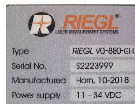
Рисунок 4 - Общий вид сканеров RIEGL VQ-880-GH