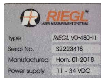
Рисунок 6 - Общий вид сканеров RIEGL VQ-480 II