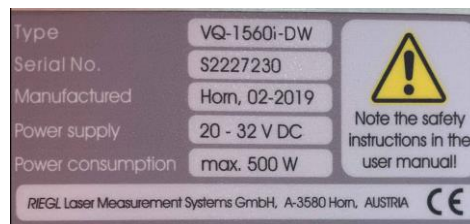
Рисунок 3 – Общий вид сканеров RIEGL VQ-1560i-DW