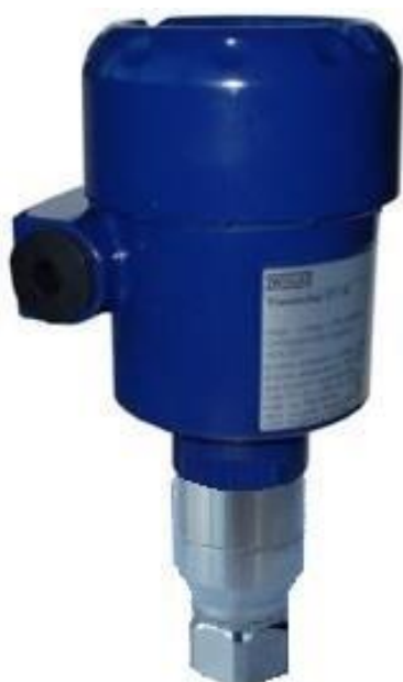
Рисунок 3 – Общий вид преобразователей IPT-20-Z, IPT-20-G (алюминиевый корпус без дисплея)