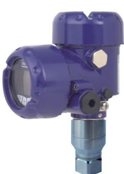
Рисунок 1 – Общий вид преобразователей IPT-20-Z, IPT-20-G (алюминиевый корпус с дисплеем)

Схема пломбировки преобразователей от несанкционированного доступа представлена на рисунке 7.