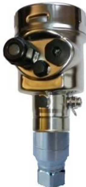
Рисунок 4 – Общий вид преобразователей IPT-20-Z, IPT-20-G (стальной корпус)