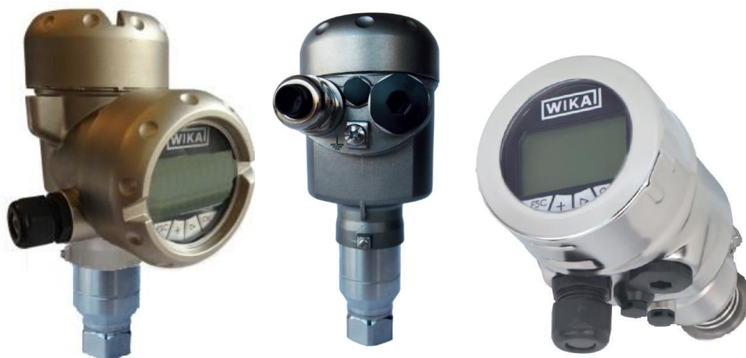
Рисунок 5 – Общий вид преобразователей IPT-20-Z, IPT-20-G (стальной корпус)