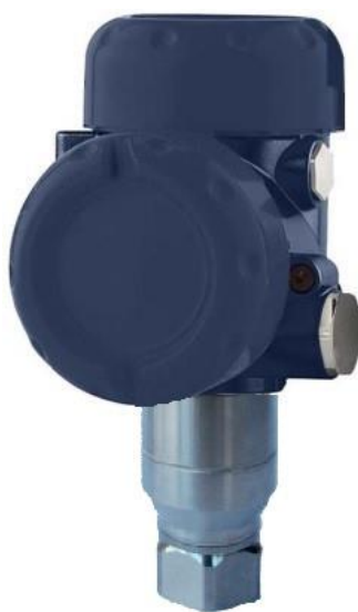
Рисунок 2 – Общий вид преобразователей IPT-20-Z, IPT-20-G (алюминиевый корпус без дисплея)