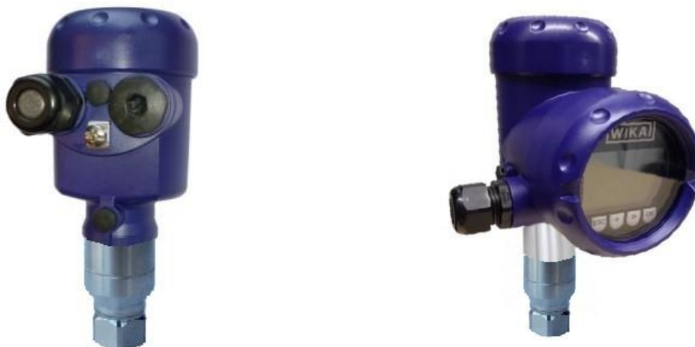
Рисунок 6 – Общий вид преобразователей IPT-20-Z, IPT-20-G (пластиковый корпус)