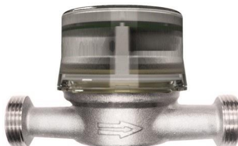
Рисунок 2 – Общий вид счетчиков с защитным колпаком