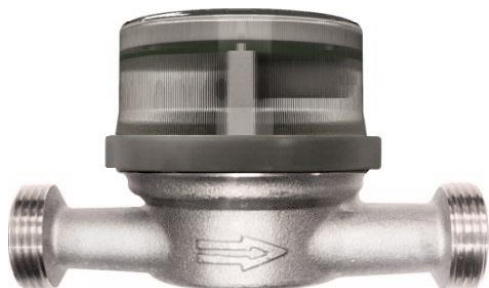
Рисунок 1 – Общий вид счетчиков с неразъёмным кольцом

Фотографии общего вида счетчиков приведены на рисунках 1 – 5.