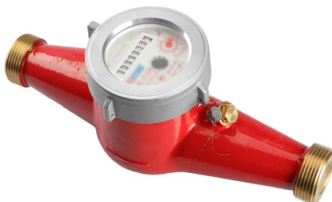
Рисунок 4 – Общий вид многоструйных счетчиков с прижимной гайкой