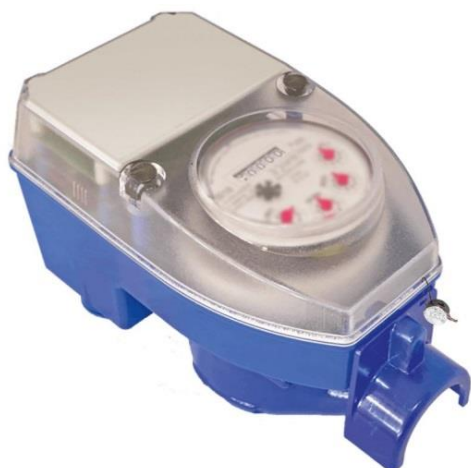
Рисунок 5 – Общий вид счетчиков с защитным кожухом