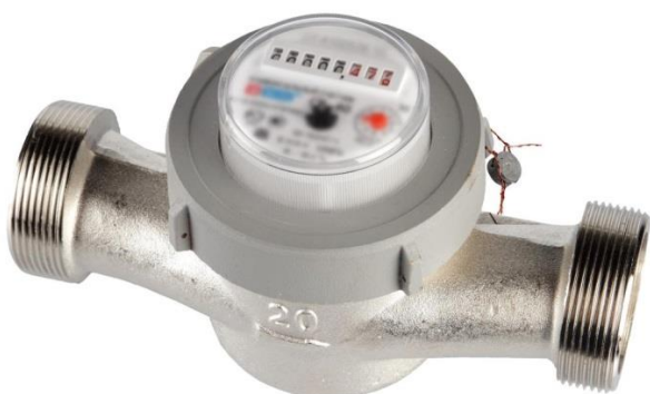
Рисунок 3 – Общий вид одноструйных счетчиков с прижимной гайкой