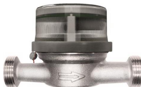
Рисунок 6 – Общий вид счетчиков с разъёмным кольцом

Счетный механизм, в зависимости от исполнения корпуса счетчика, соединяется с проточной частью посредством неразъемного кольца (рисунок 1), защитного колпака (рисунок 2), прижимной гайкой (рисунок 3 и рисунок 4), защитного кожуха (рисунок 5) или разъемного кольца (рисунок 6).