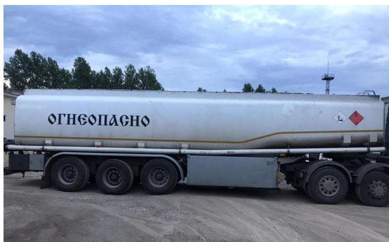
Рисунок 1 – Общий вид полуприцепа-цистерны KAESSBOHRER

Общий вид полуприцепа-цистерны KAESSBOHRER представлен на рисунках 1-2.