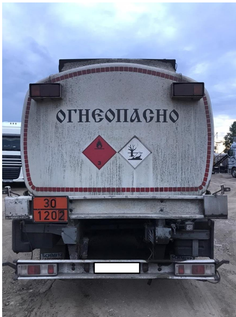
Рисунок 2 – Общий вид полуприцепа-цистерны KAESSBOHRER

Схема пломбировки для защиты от несанкционированного изменения положения уровня налива, обозначение места нанесения знака поверки представлены на рисунке 3.