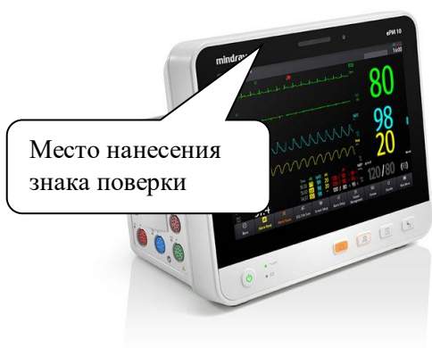
Рисунок 1 – Общий вид систем мониторинга физиологических показателей моделей ePM10, ePM12, ePM15, ePM10M, ePM12M, ePM15M