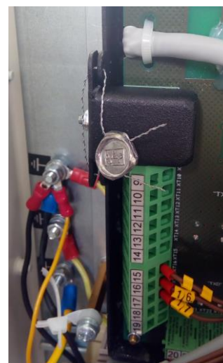
Рисунок 3 - Место нанесения пломбы поверителя на пластину, закрывающую контакты на плате процессорной устройства приема и обработки сигналов «Топаз-273Е»