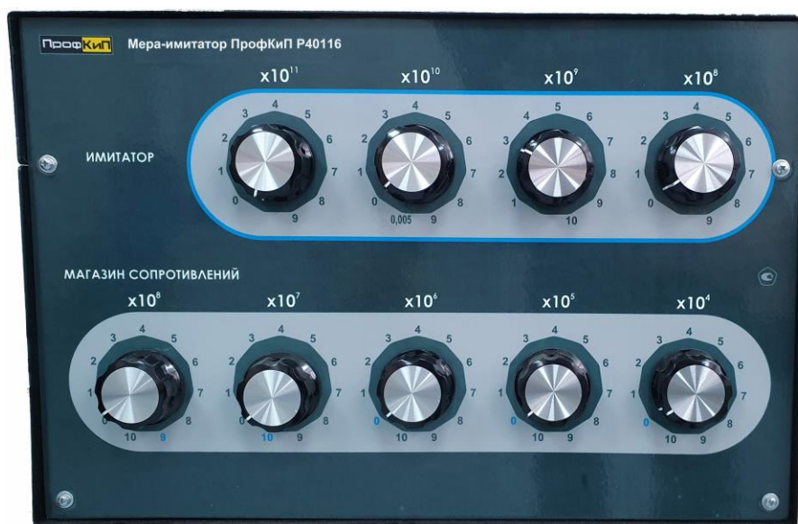
Рисунок 1 – Общий вид средства измерений