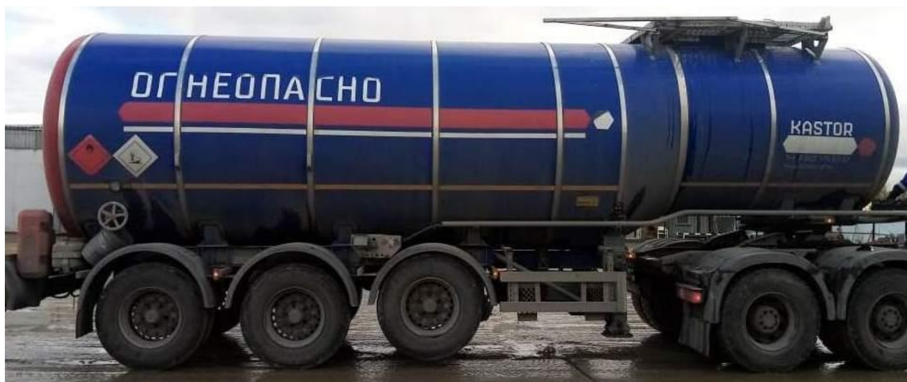
Рисунок 2 – Общий вид ППЦ SF3B30