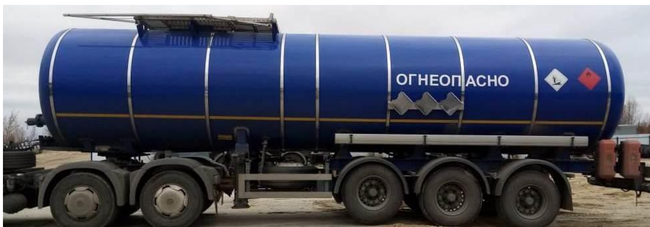
Рисунок 1 – Общий вид ППЦ SF3B28