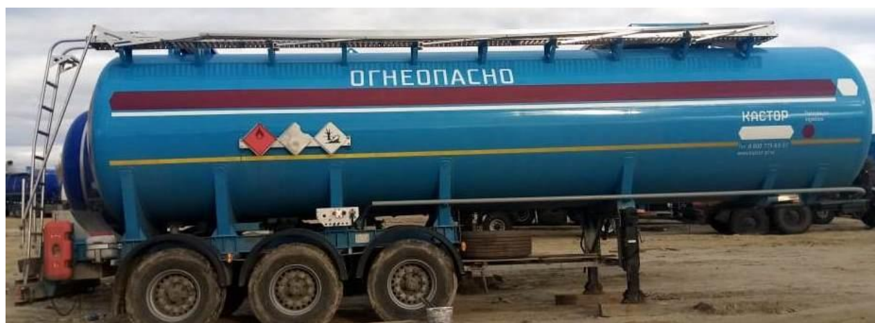
Рисунок 3 – Общий вид ППЦ SF3938

Схема пломбировки от несанкционированного изменения положения указателя уровня налива, обозначение места нанесения знака поверки представлены на рисунке 4.