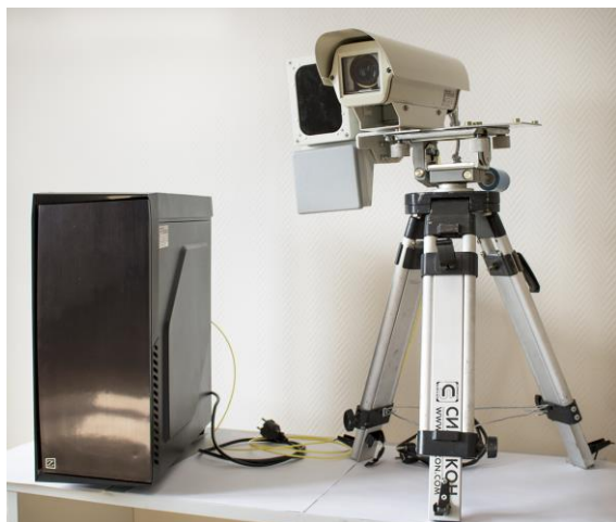
Комплекс «Кордон-Кросс» с видеодатчиком «Кросс»ДР