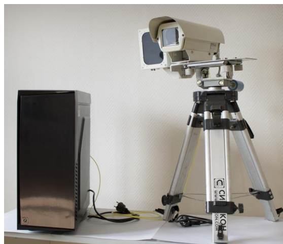
Комплекс «Кордон-Кросс»В с видеодатчиком «Кросс»К