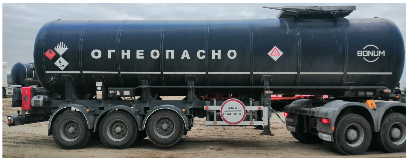
Рисунок 1 – Общий вид ППЦ BONUM 914220-01