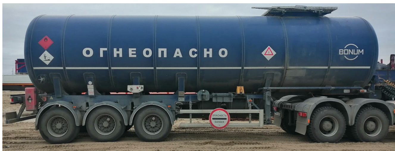
Рисунок 2 – Общий вид ППЦ BONUM 914220-02

Схема пломбировки от несанкционированного изменения положения указателя уровня налива, обозначение места нанесения знака поверки представлены на рисунке 3.