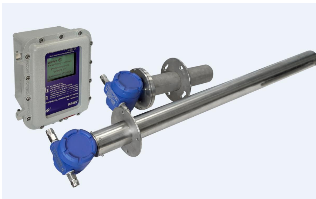
Рисунок 1 - Общий вид расходомеров-счетчиков ультразвуковых ВЗЛЕТ РГ

Пломбировка от несанкционированного доступа расходомеров-счетчиков ультразвуковых ВЗЛЕТ РГ осуществляется нанесением знака поверки давлением на пломбировочную мастику, расположенную в пластиковом колпачке (или пломбировочной чашке с металлической скобой), которые предотвращают доступ к контактной паре переключения режимов работы. Места пломбировки расходомеров-счетчиков ультразвуковых ВЗЛЕТ РГ приведены на рисунке 2.