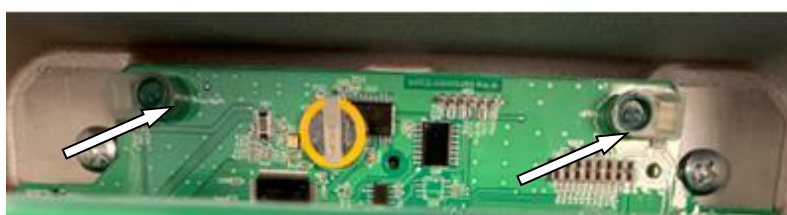
Рисунок 2 – Места пломбировки расходомеров-счетчиков ультразвуковых ВЗЛЕТ РГ