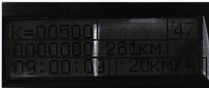
Рисунок 3 – Экран «Метрология» тахографа

8.3.6 Определить среднее квадратическое отклонение (СКО) случайной составляющей погрешности измерения интервала времени по формуле (4):