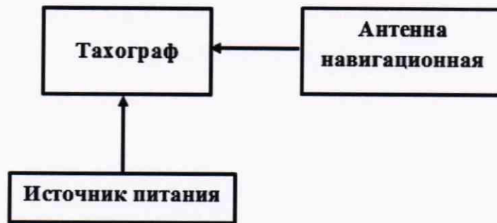
Рисунок 1 – Схема проведения измерений при опробовании

8.2.1 Собрать схему в соответствии с рисунком 1. Обеспечить радиовидимость сигналов ГЛОНАСС/GPS в верхней полусфере.