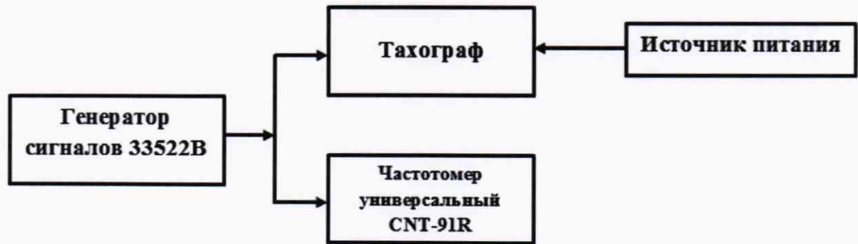
Рисунок 2 – Схема проведения измерений при определении абсолютной погрешности измерений интервала времени и абсолютной инструментальной погрешности измерений пройденного пути

8.3.1 Собрать схему в соответствии с рисунком 2.