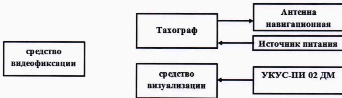
Рисунок 5 - Схема проведения измерений при определении абсолютной погрешности синхронизации шкалы времени внутреннего опорного генератора тахографа со шкалой времени блока СКЗИ

8.10.1 Собрать схему в соответствии с рисунком 5. Средство визуализации должно иметь разрешающую способность индикации оцифровки метки времени не менее 0,1 с.