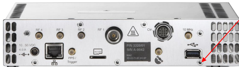
Рисунок 4 – Общий вид анализатора SignalShark 3320 (задняя панель)