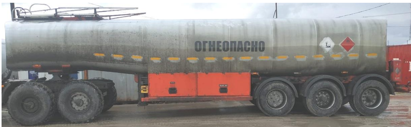
Рисунок 1 – Общий вид ППЦ