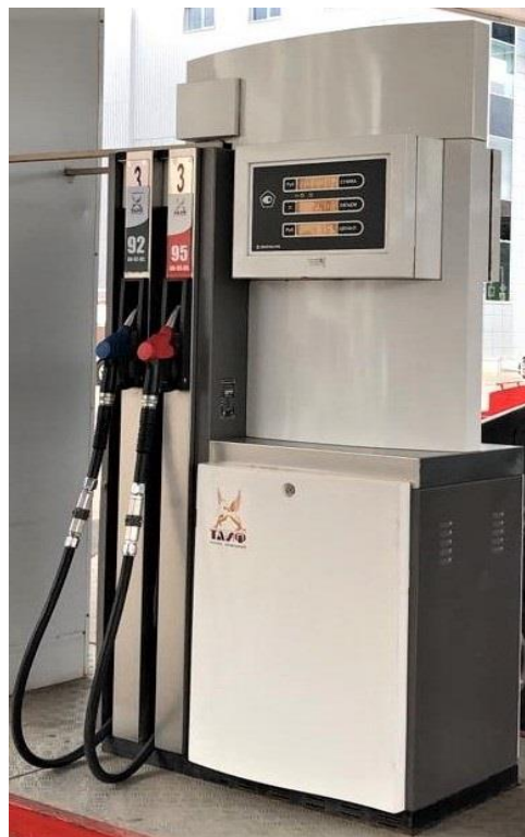
Исполнение BMP 2024OC E