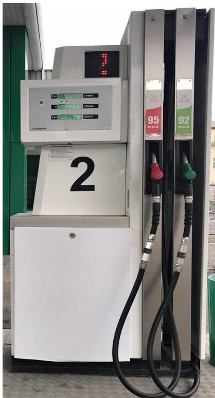
Исполнение BMP 2024OC V

Общий вид колонки приведен на рисунке 1, места пломбирования на рисунках 2 – 3.