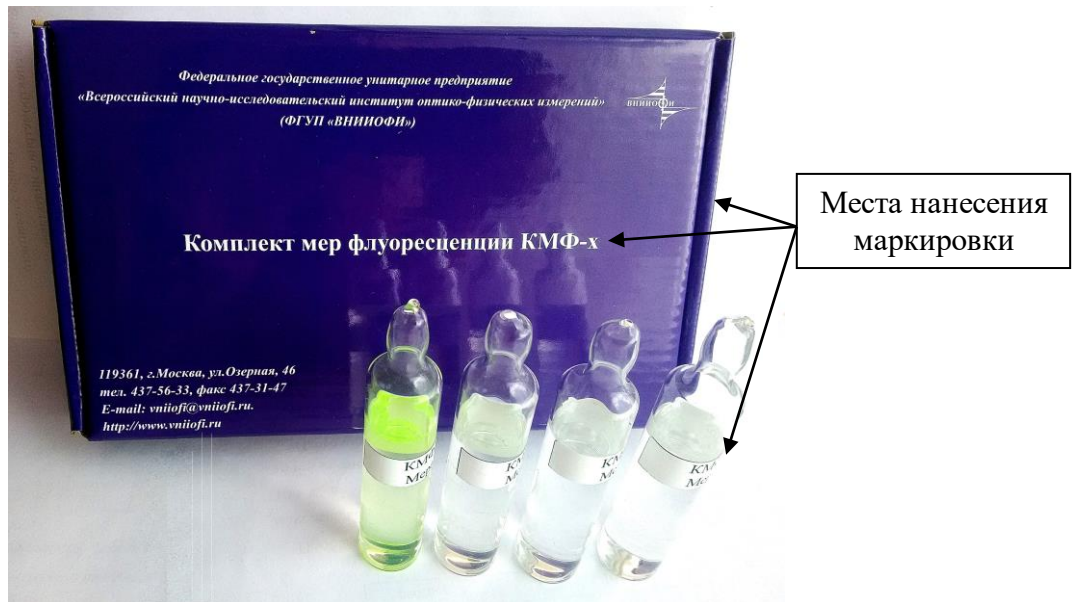
Рисунок 1 – Общий вид комплекта мер с указанием мест нанесения маркировки