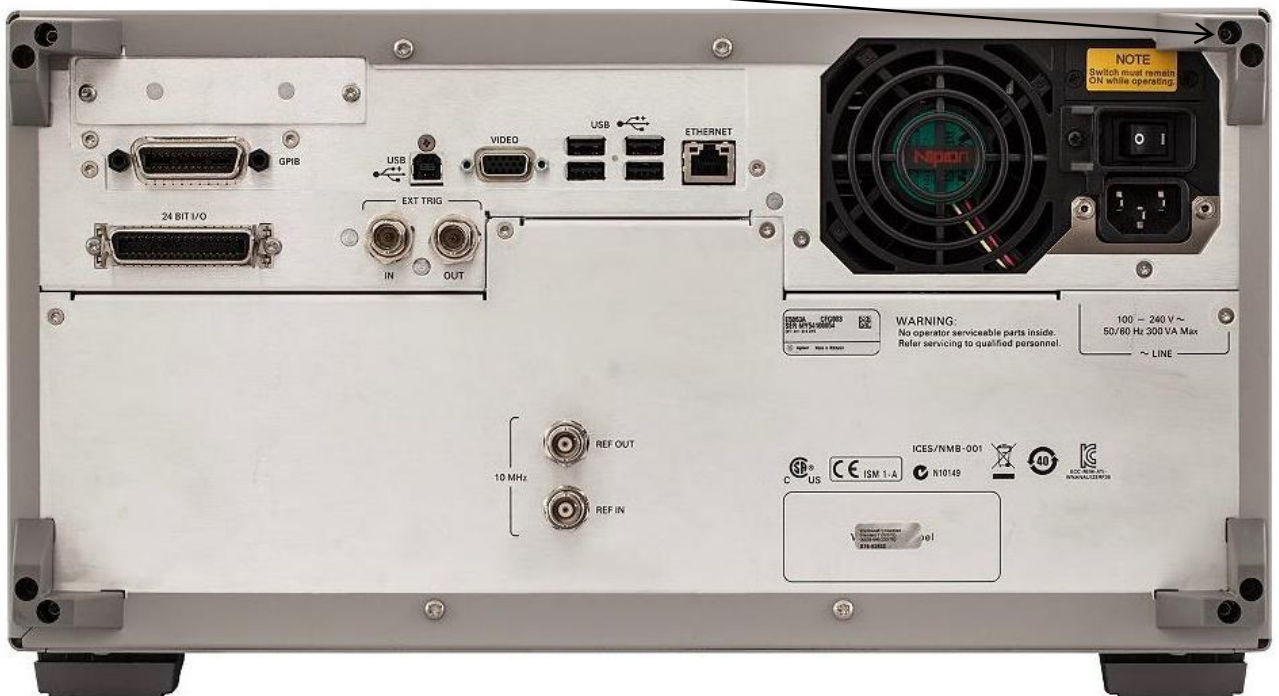
Рисунок 2 – Общий вид задней панели анализатора E5063A