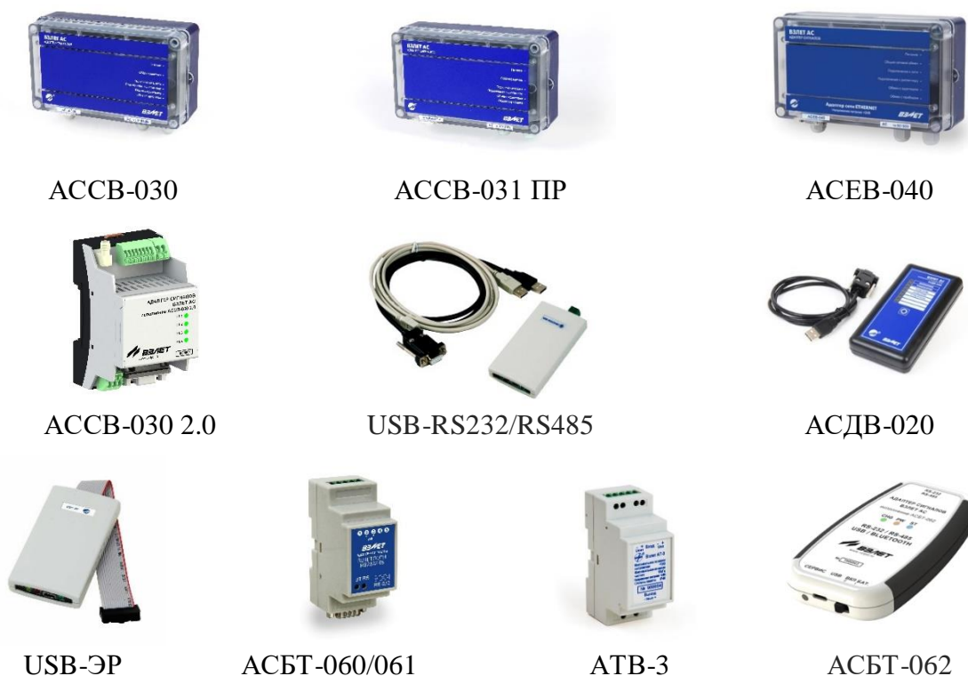
Рисунок 1 – Общий вид преобразователей

Общий вид преобразователей представлен на рисунке 1.