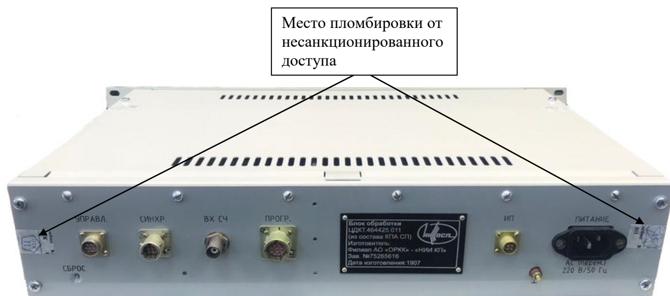
Рисунок 3 – Общий вид задней панели КПА СП