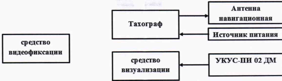
Рисунок 5 - Схема проведения измерений при определении абсолютной погрешности синхронизации шкалы времени внутреннего опорного генератора тахографа со шкалой времени блока СКЗИ

8.10.2 Обеспечить радиовидимость сигналов навигационных космических аппаратов ГЛОНАСС и GPS в верхней полусфере. В соответствии с эксплуатационной документацией на тахограф и УКУС-ПИ 02ДМ подготовить их к работе. Настроить УКУС-ПИ 02ДМ на выдачу шкалы времени, синхронизированной с национальной шкалой координированного времени UTC(SU).