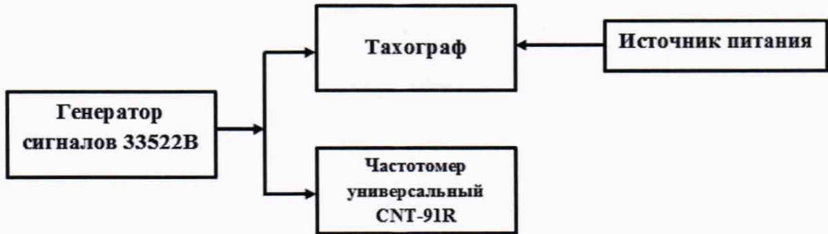
Рисунок 2 – Схема проведения измерений при определении абсолютной погрешности измерений интервала времени и абсолютной инструментальной погрешности измерений пройденного пути

8.3.1 Собрать схему в соответствии с рисунком 2.