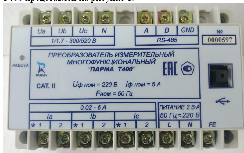
Рисунок 1 – Внешний вид Преобразователя измерительного многофункционального «ПАРМА Т400»

Общий вид T400 представлен на рисунке 1.