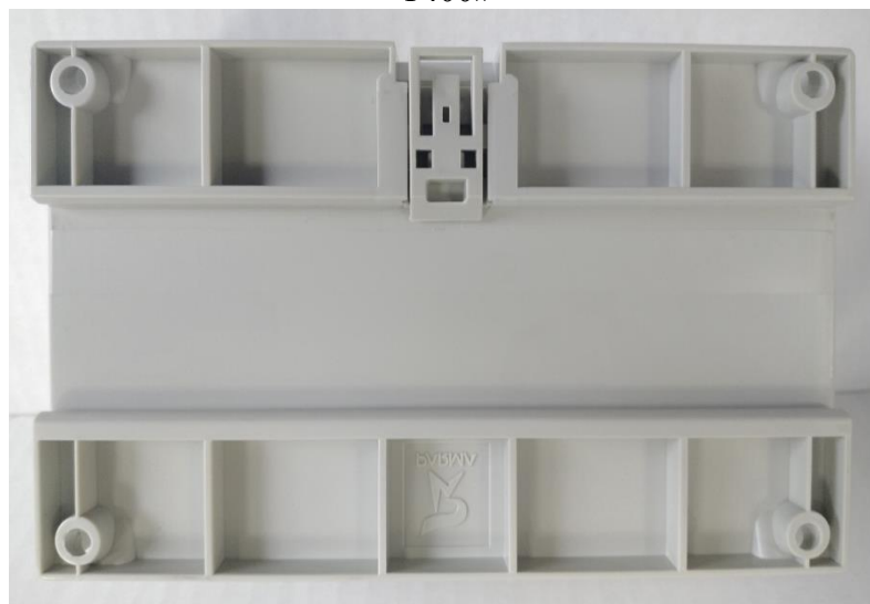
Рисунок 2 – Тыльная панель преобразователя измерительного многофункционального «ПАРМА Т400»