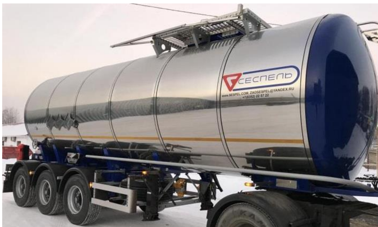
Рисунок 3 – Общий вид ППЦ SF3B30

Схема пломбировки от несанкционированного изменения положения указателя уровня налива, обозначение места нанесения знака поверки представлены на рисунке 4.