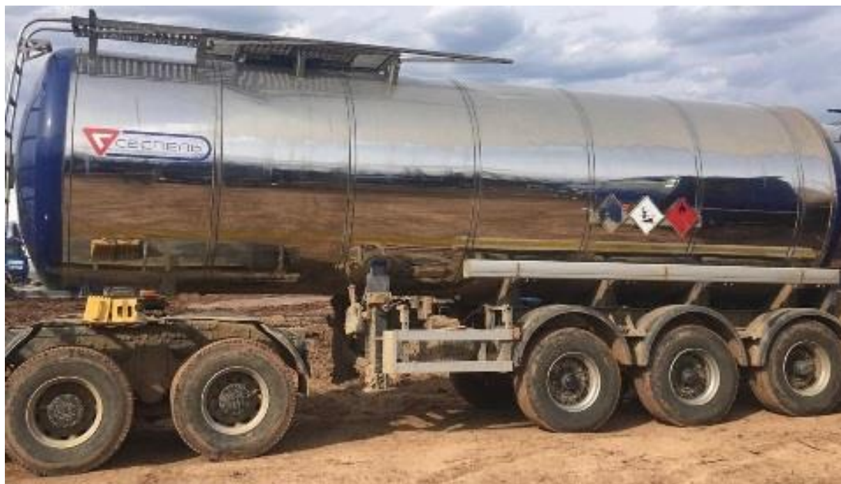
Рисунок 2 – Общий вид ППЦ SF3B28