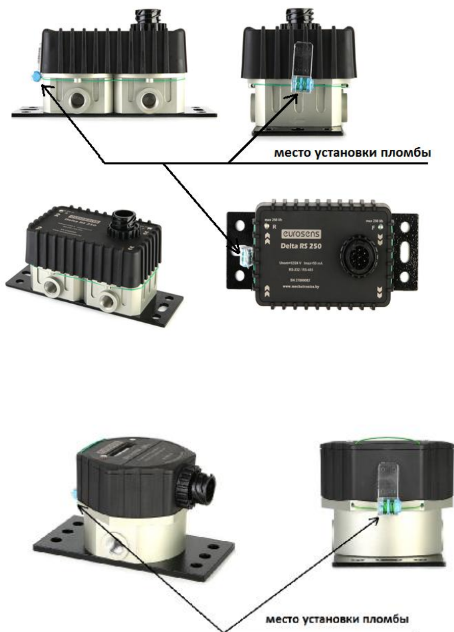
Рисунок 5 – Схема пломбировки от несанкционированного доступа, обозначение места нанесения знака поверки

Схема пломбирования счетчиков для защиты от несанкционированного доступа с указанием мест для нанесения знака поверки приведена на рисунке 5.