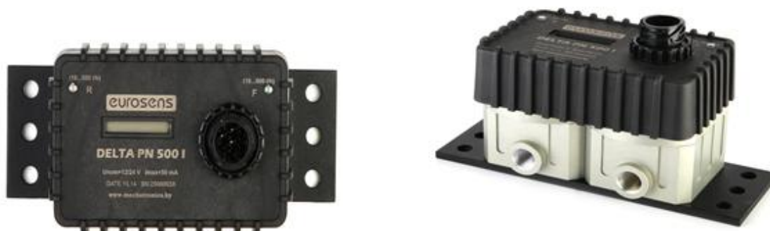
Рисунок 4 – Внешний вид счетчиков EUROSENS Delta I (с дисплеем)