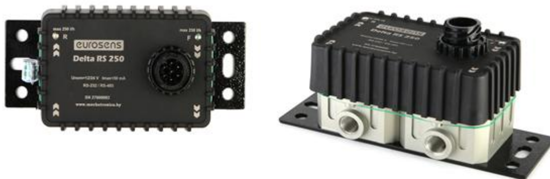
Рисунок 3 – Внешний вид счетчиков EUROSENS Delta (без дисплея)