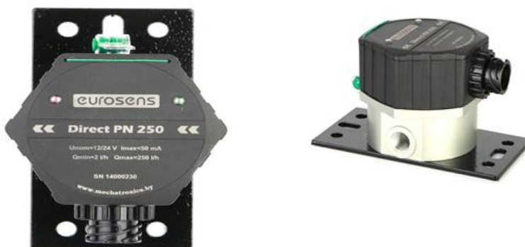
Рисунок 1 – Внешний вид счетчиков EUROSENS Direct (без дисплея)