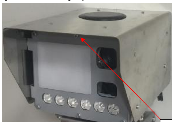
Вид ИМ спереди

Общий вид ИМ и ВС, места нанесения маркировки, знака утверждения и пломб представлены на рисунках 1 и 2.