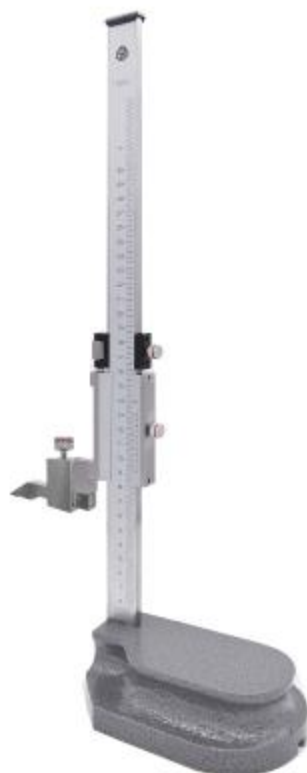
Рисунок 1 – Общий вид штангенрейсмасов с отсчетом по нониусу