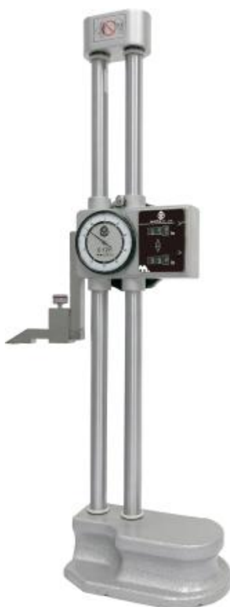
Рисунок 2 – Общий вид штангенрейсмасов с отсчетом по круговой шкале