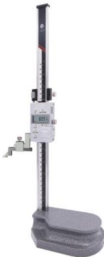
Рисунок 3 – Общий вид штангенрейсмасов с цифровым отсчетным устройством