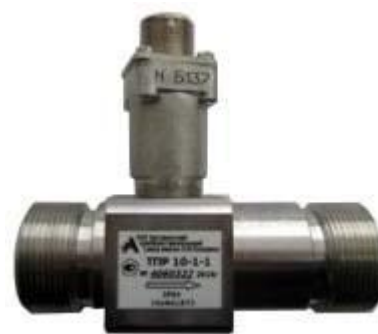
Рисунок 5 – Датчик расхода