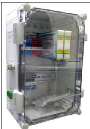
Рисунок 3 – Шкаф кроссовый