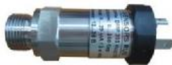
Рисунок 7 – Датчик давления DMP