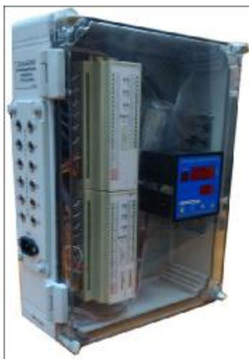
Рисунок 4 – Шкаф измерительный температуры