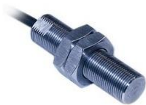
Рисунок 6 – Датчик тахометрический МЭД-1