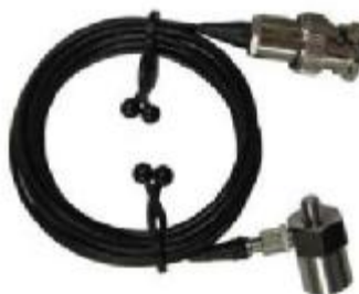
Рисунок 10 – Вибропреобразователь АР2037