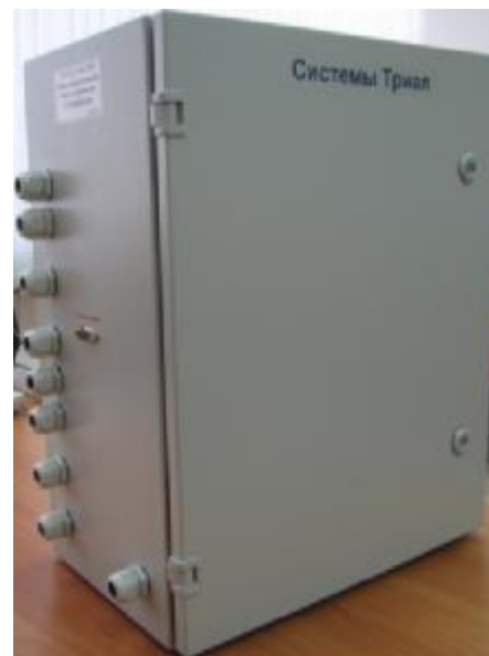
Рисунок 2 – Шкаф измерительный тока и напряжения