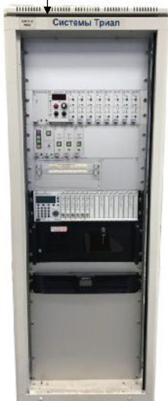
Рисунок 1 – Общий вид стойки управления

Место нанесения знака утверждения типа и знака поверки