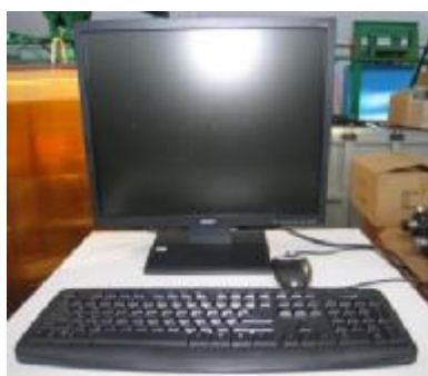
Рисунок 12 – Рабочее место оператора