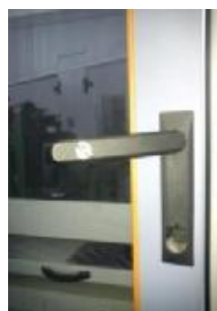
Рисунок 13 – Внешний вид замка на двери стойки управления