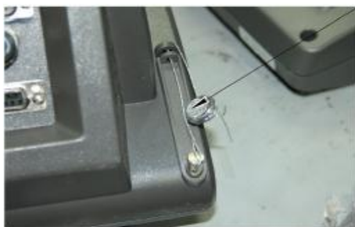
Весы с индикаторами МИ ВДА/12Я, МИ ВДА/7Я