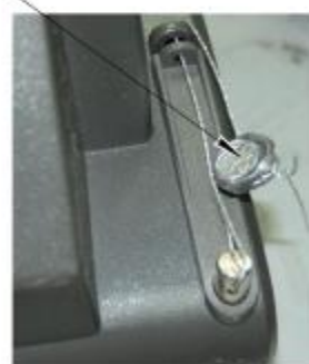
Весы с индикаторами МИ ВЖА/12Я, МИ ВЖА/7Я