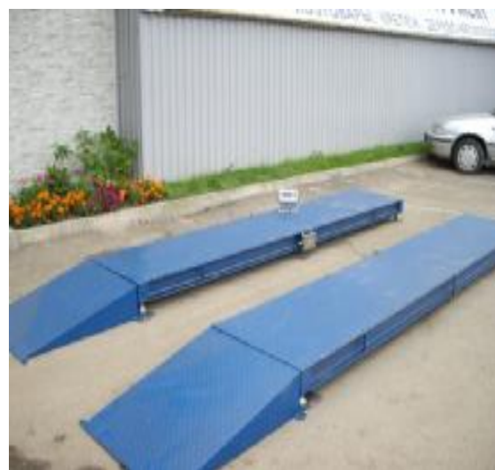
Общий вид портативных весов с многосекционным ГПУ