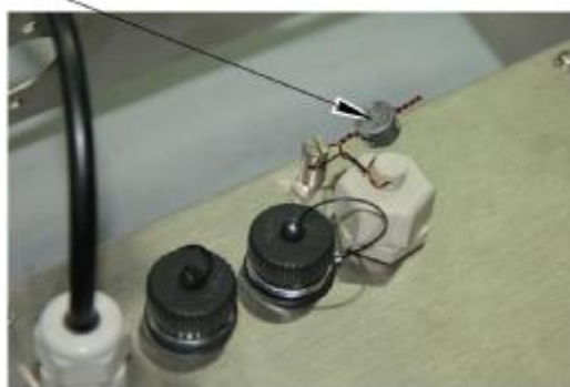
Весы с индикатором МИ ВДА/12ЯС