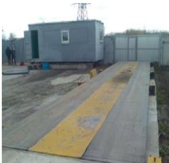
Общий вид стационарных весов с многосекционным ГПУ