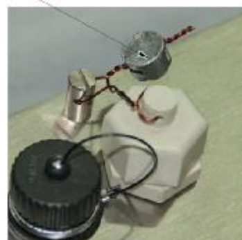
Весы с индикатором МИ ВЖА/А12ЯС