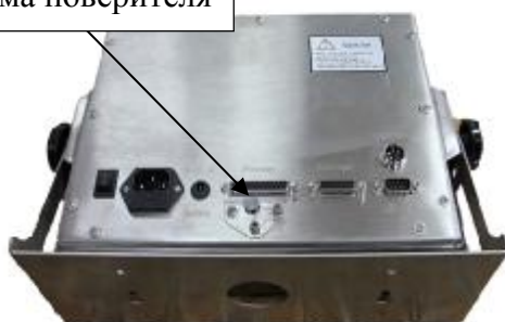
Весы с индикатором МИ ВДА/12ЦС