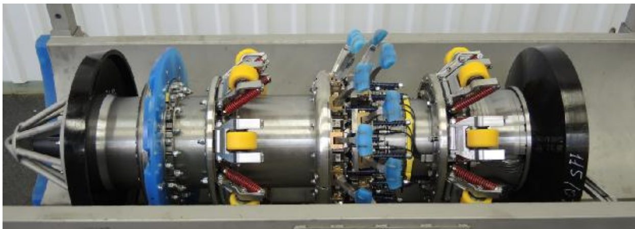
Рисунок 1 – Общий вид внутритрубного дефектоскопа определения положения трубопровода 16-ОПТ.00-01.000