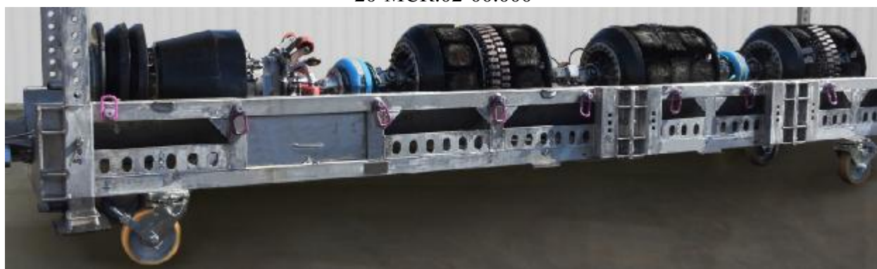
Рисунок 5 – Общий вид дефектоскопа магнитного комбинированного 28-MCK.10-00.000