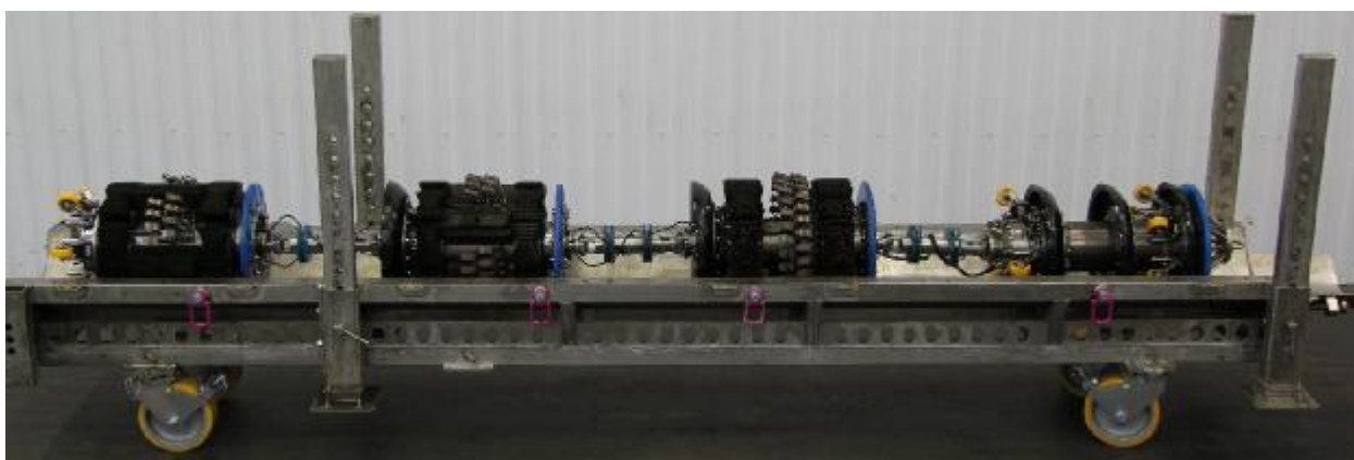
Рисунок 4 – Общий вид дефектоскопа магнитного комбинированного 20-MCK.02-00.000