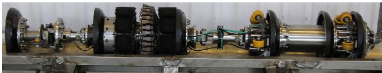
Рисунок 1 – Общий вид дефектоскопа магнитного комбинированного 12-МСК.01-00.000

Фотография общего вида дефектоскопов представлена на рисунках 1-8.