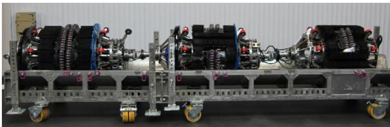
Рисунок 8 – Общий вид дефектоскопа магнитного комбинированного 48-MCK.02-00.000

Пломбирование дефектоскопов не предусмотрено.