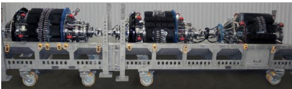
Рисунок 7 – Общий вид дефектоскопов магнитных комбинированных 40-MCK.02-00.000, 40-MCK.10-00.000