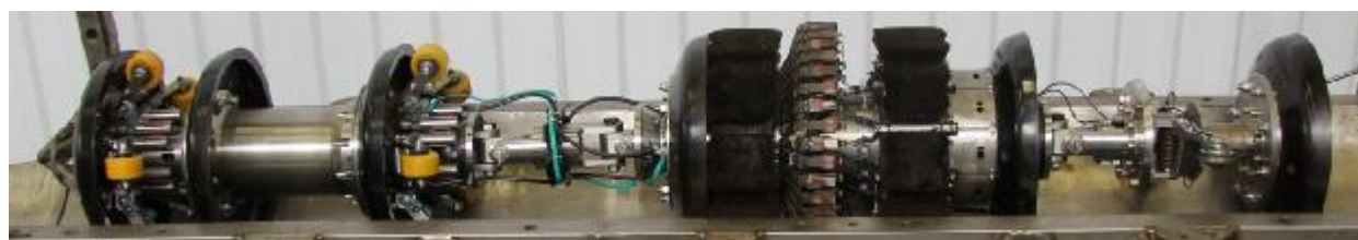
Рисунок 2 – Общий вид дефектоскопа магнитного комбинированного 14-МСК.01-00.000